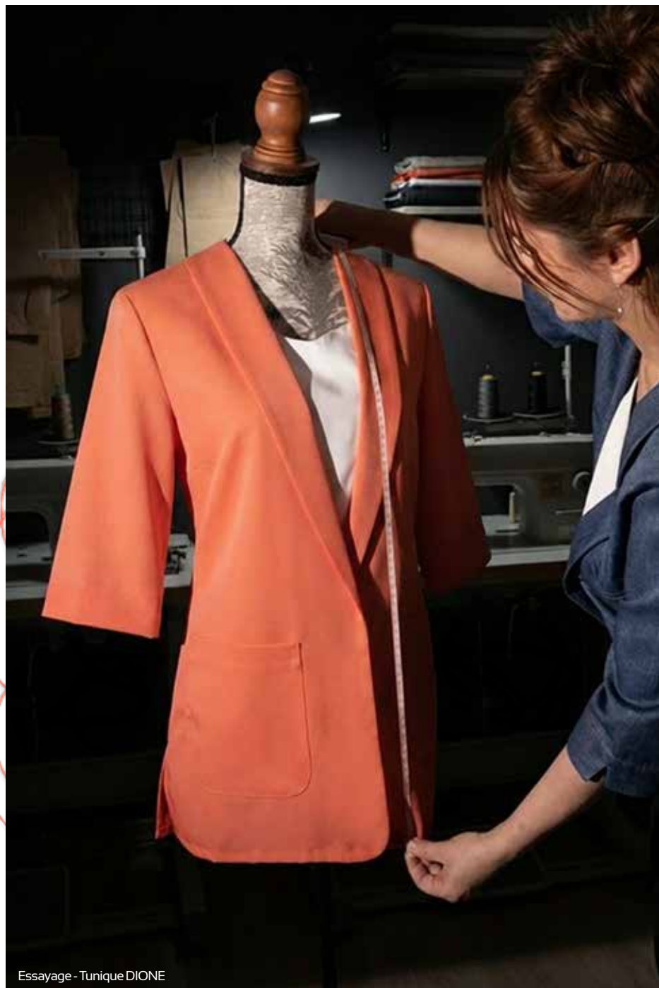
Essayage - Tunique DIONE