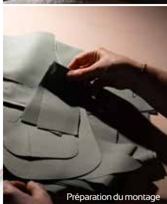
Préparation du montage